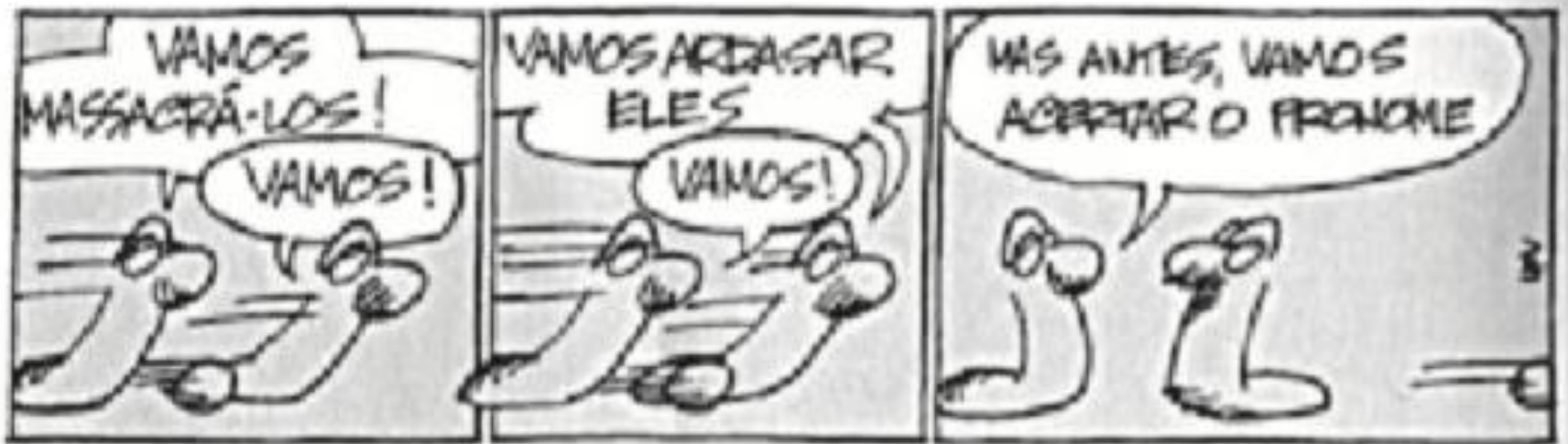
VERÍSSIMO, L. F. As cobras em: Se Deus existe que eu seja atingido por um raio. Porto Alegre: L&PM, 1997.