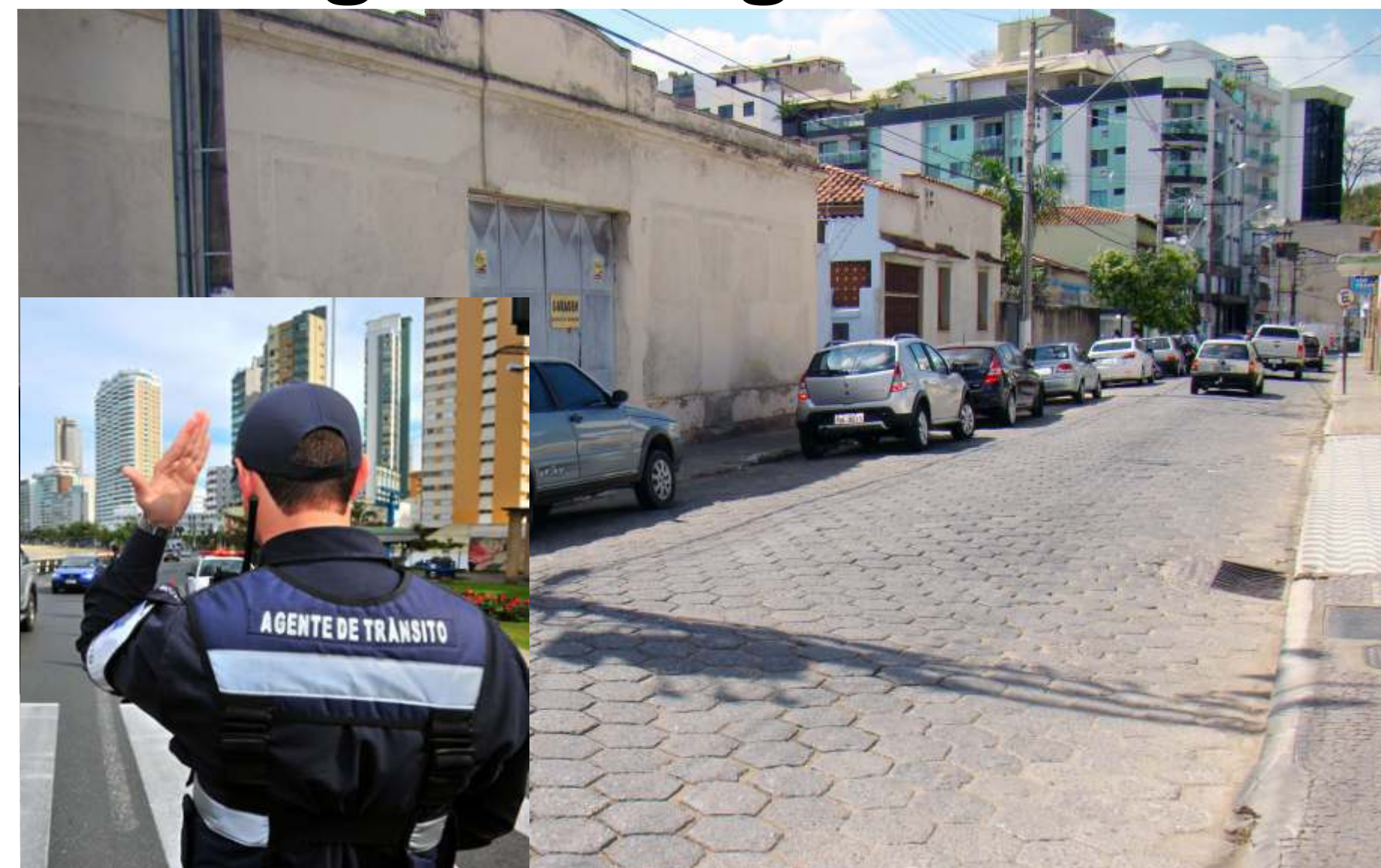
Com a presença dos Agentes de Trânsito, o fluxo de veículos pode melhorar

Foi aprovado por unanimidade o Projeto de Lei Complementar nº 012/14 que "Autoriza a criação de 12 (doze) Cargos de Agente de Trânsito no Quadro de Cargos do Poder Executivo do Município de Ubá e dá outras providências", de autoria do Executivo.