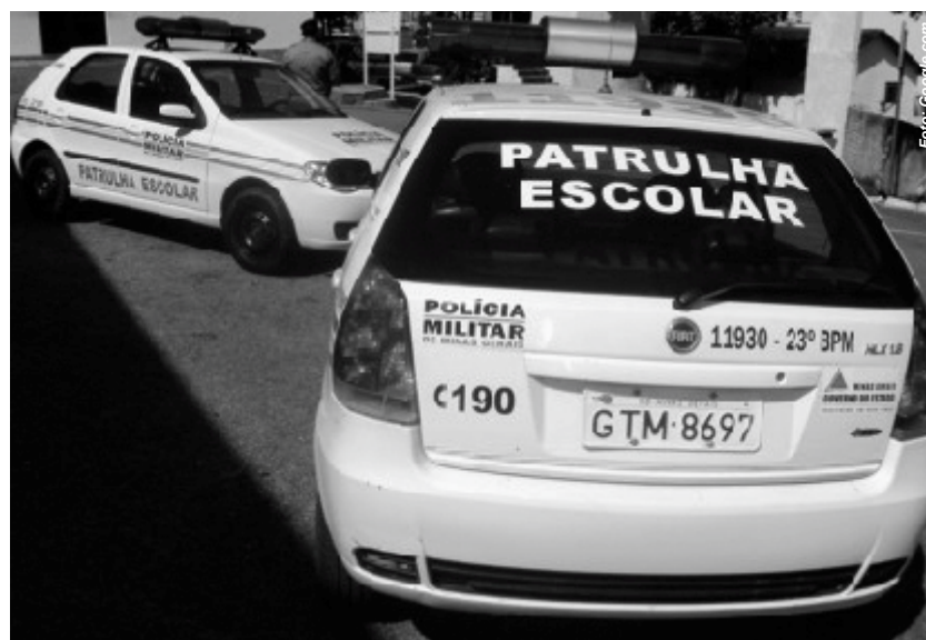
Patrulha escolar seria solução, segundo vereadores

O comando do batalhão reforçou o trabalho da polícia militar nas escolas através do PROERD, JCC, além de palestras, quando solicitadas, bem como as guarnições de serviço, que frequentemente passam nas imediações das escolas como forma de prevenir ocorrências de crimes nestes locais.