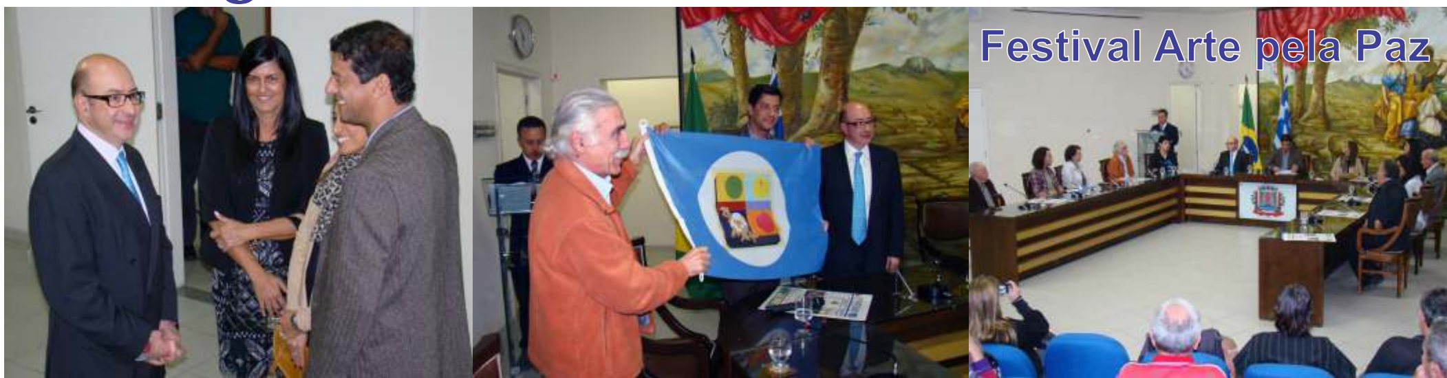
Festival Arte pela Paz