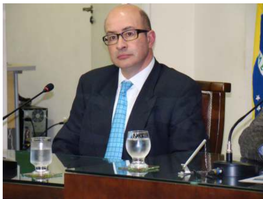
O embaixador da Grécia no Brasil, Dimitri Alexandrakis