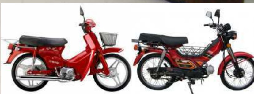
Os Vereadores irão discutir o projeto que sofrerá duas votações. Somente após este trâmite, será encaminhado para sanção do prefeito municipal. Em destaque, dois exemplos de ciclomotores.

Embora tenha transcorrido quase 15 anos desde a vigência do CTB (1997) e a existência de um grande número de ciclomotores circulando em vias públicas locais, não há, ainda, uma legislação municipal assumindo o direito de registrar tais veículos.