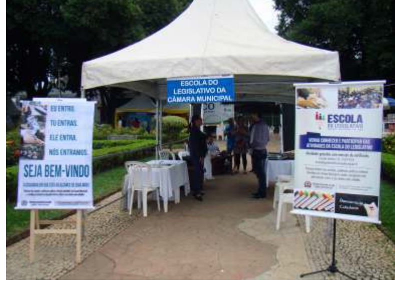
Estande apresenta à população as funções do Legislativo

gratuitamente, à comunidade: Escola do Legislativo, Escola na Câmara, Câmara Mirim, Internet Popular, Centro de Atenção ao Cidadão, Exposições Itinerantes, etc. Os servidores da Câmara ouviram e registraram demandas da população, que foram transmitidas aos Vereadores. O evento foi realizado pela TV Integração, em parceria com instituições da cidade. O objetivo foi levar à população serviços gratuitos nas áreas de saúde,