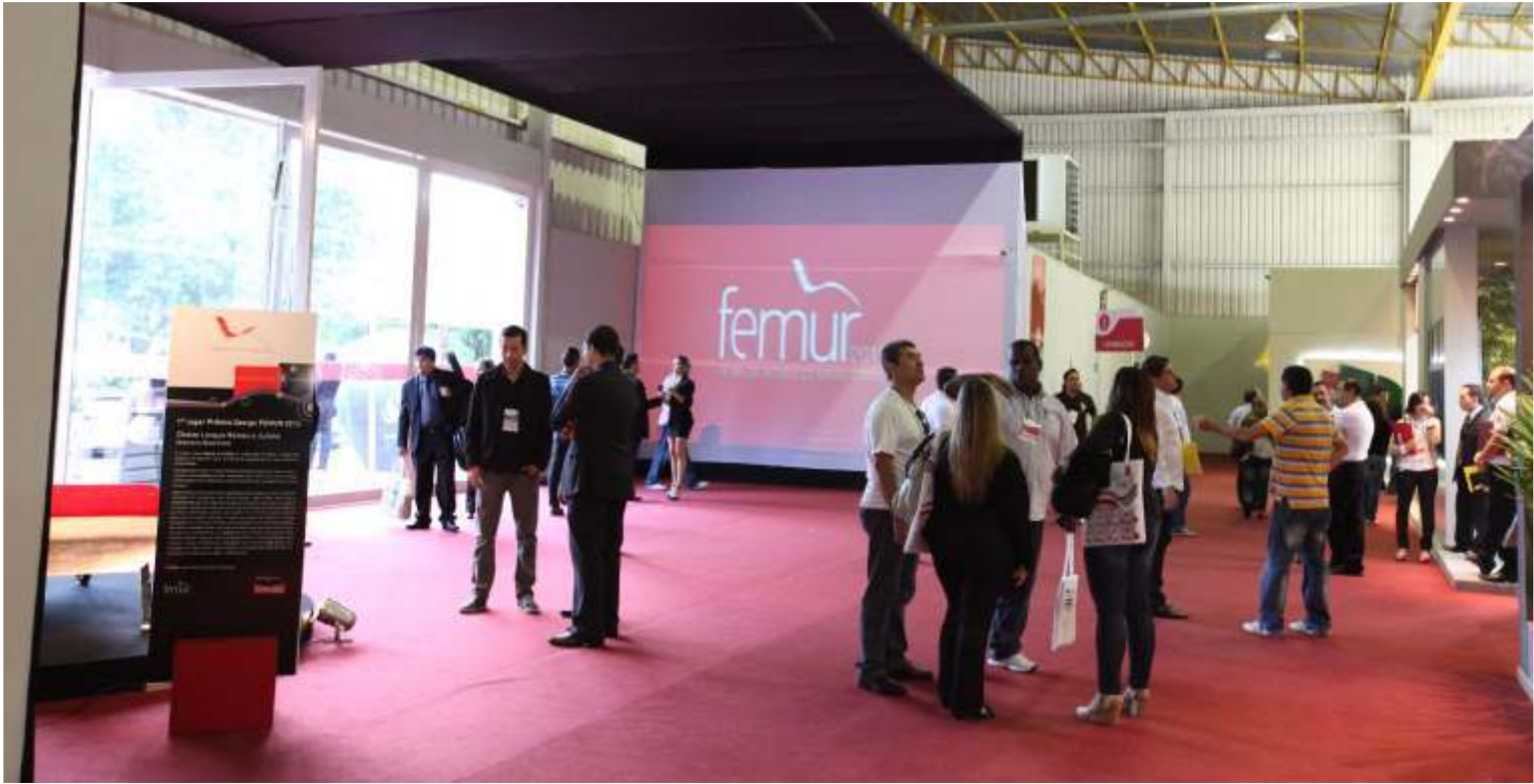
A Feira de Móveis de Ubá e Região (FEMUR) é uma das maiores feiras especializadas em móveis no país e onde o setor tem um grande volume de vendas. A próxima edição da Feira será em 2016

A Frente irá empenhar-se politicamente, perante os governos estadual e federal, principalmente na luta pela equiparação do Imposto Sobre Circulação de Mercadorias e Serviços (ICMS), alvo de guerra fiscal entre Minas, Rio de Janeiro e Espírito Santo, e que vem prejudicando as indústrias da região. Uma Lei aprovada pelo