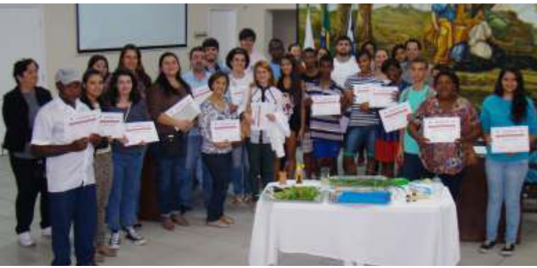
Estudantes e profissionais compareceram às palestras

Em maio, mês que antecede as comemorações do Dia Mundial do Meio Ambiente (05/06), a Câmara Municipal de Ubá (CMU), através da Escola do Legislativo, preparou uma programação dedicada ao assunto. O objetivo principal foi chamar a atenção da população para os problemas ambientais e para a importância da conservação dos recursos naturais, até então consi-