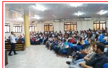
Palestra “Segurança no Trânsito” Escola Estadual Camilo Soares 08/08/17