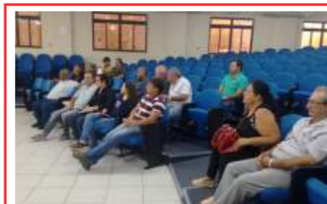
Reunião do Conselho Municipal de Desenvolvimento Rural Sustentável 31/08/17