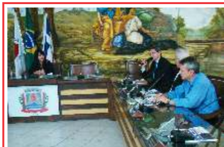
Reunião Pública Projeto “Troco Solidário” 21/08/17