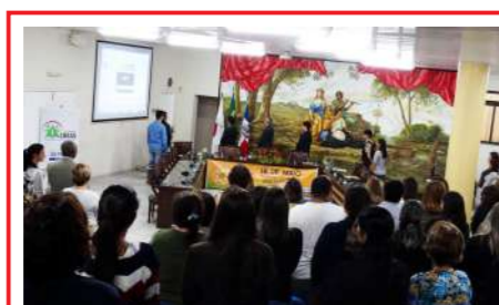
Fórum sobre Combate ao Abuso e Exploração Sexual de Crianças e Adolescentes Sec. Mun. Desenvolvimento Social/CREAS 17/05/2018