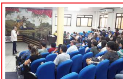
Palestras sobre serviços do INSS - Instituto Nacional de Seguridade Social 22, 23 e 24/05/2018