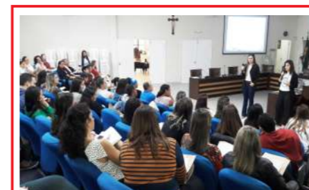
I Capacitea/Ubá AUFA - Associação Ubaense de Famílias e Amigos dos Autistas / Apoio: SRE-Ubá 26/05/2018