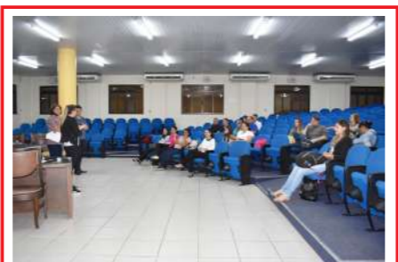
Reunião de apresentação dos candidatos a Conselheiros Tutelares 27/09/19