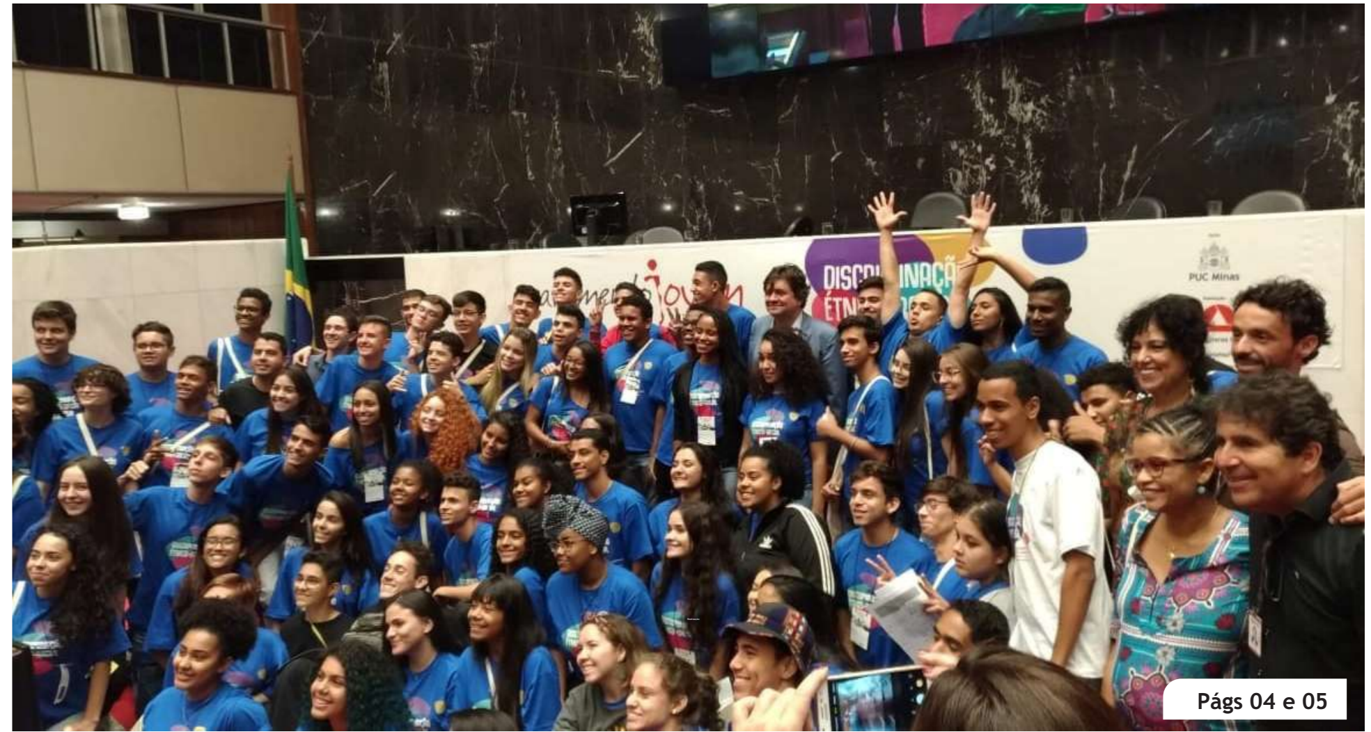
Págs 04 e 05