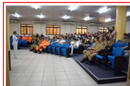
Palestra: Prevenção ao Suicídio Polícia Militar de Minas Gerais 24/09/19