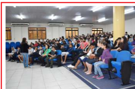
Palestra: Prevenção ao Suicídio E. E. Cel. Camilo Soares 27/09/19