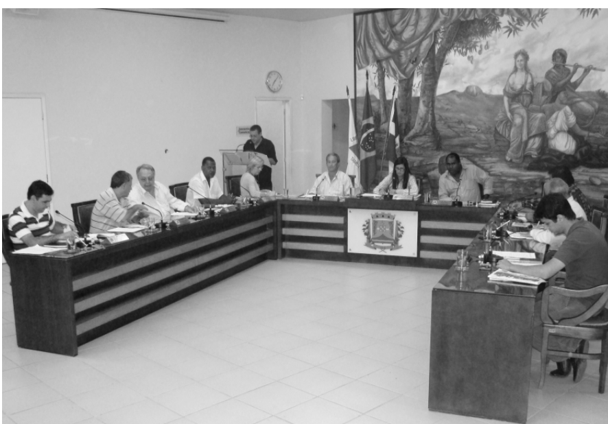
A Representação foi aprovada durante a reunião ordinária do dia 20/09

De autoria do Governador do Estado, o Projeto de Lei nº 2.355/2011 foi publicado no dia 07/09 e distribuído às Comissões de Constituição e Justiça, de Administração