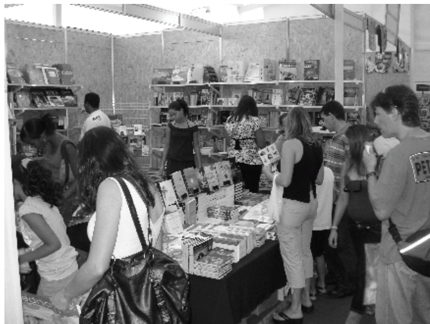
Feira do Livro marcou época na cidade

É por isso que, além de investir em bibliotecas – e transformá-las em centros dinâmicos de cultura – o MinC tem também promovido o incentivo à leitura, por meio de agentes de leitura – mais de 3,6 mil em todo o país – e a criação