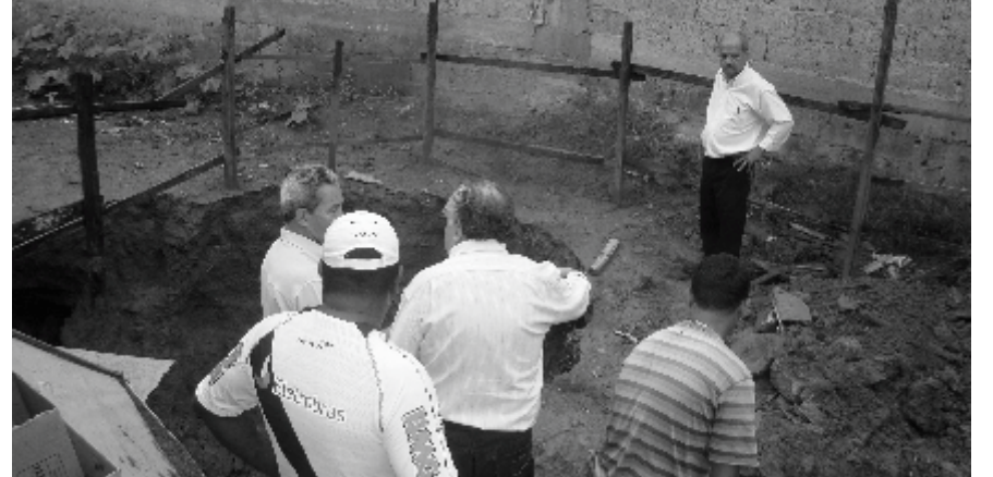
Os Vereadores puderam constatar 'in loco' os danos