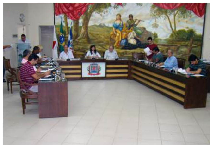
Os Vereadores aprovaram proposição que solicita a implantação de um restaurante popular em Ubá

de vida de diversos ubaenses”, justifica o Vereador.