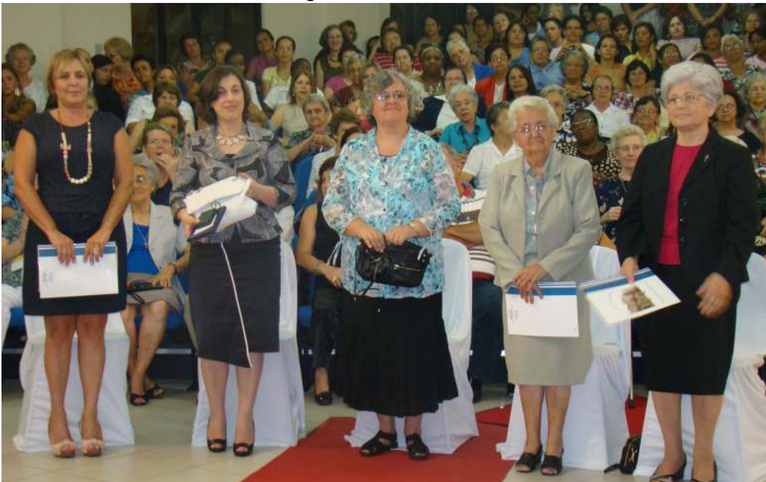
Solenidade de Abertura das comemorações do Centenário da Presença das Religiosas do Sagrado Coração de Maria no Brasil aconteceu no dia 18/03