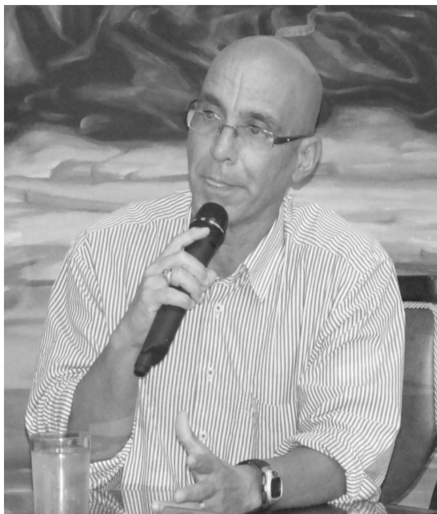
“O crack está invadindo nossa cidade”, disse o Juiz