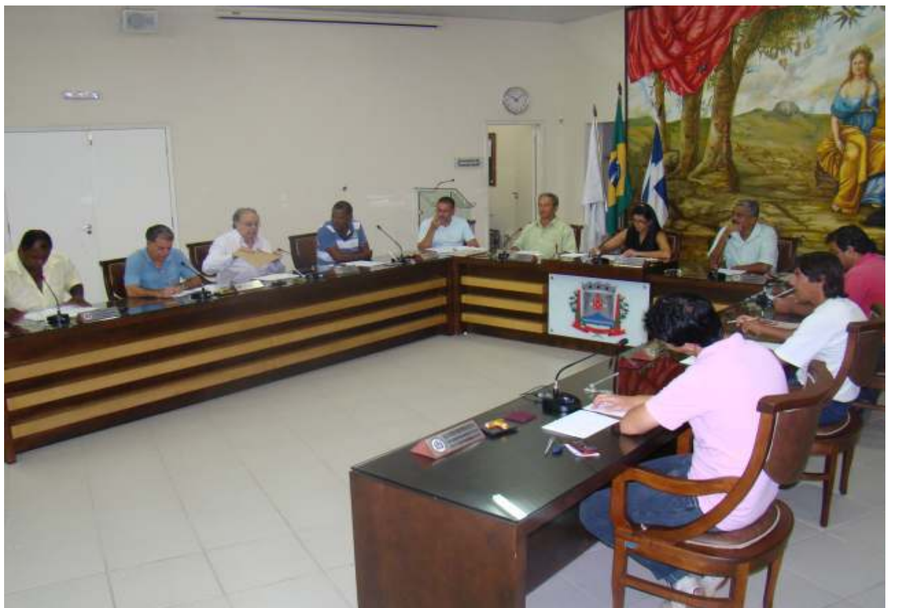
O Projeto de Lei Complementar foi aprovado em duas sessões extraordinárias realizadas no dia 02/03