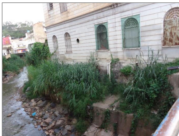
Foto 04 - Trecho do Ribeirão Ubá – Caladão Deputado Ibrahim Jacob