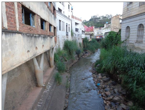
Foto 02 - Trecho do Ribeirão Ubá – Caladão Deputado Ibrahim Jacob