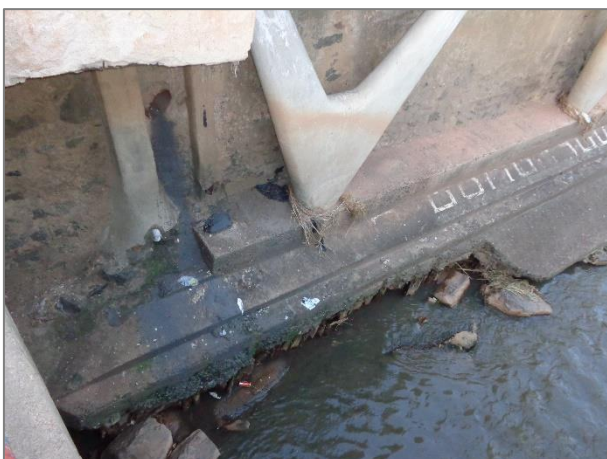
Foto 03 - Trecho do Ribeirão Ubá – Caladão Deputado Ibrahim Jacob